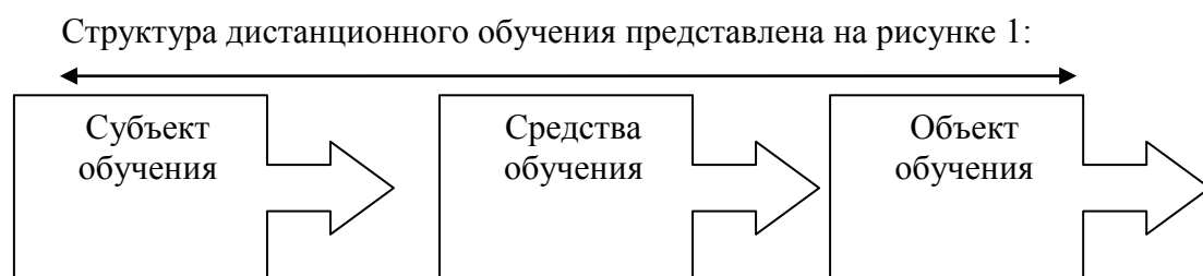
Рис. 1 Структура дистанционного обучения

предусматривающими интерактивность. В настоящее время существуют и другие варианты этого термина: дистантное образование, дистанционное образование. При дистанционном обучении основным является принцип интерактивности во взаимодействии между обучающимися и преподавателем.